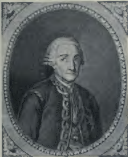
Le Comte d'Aranda.

« M. d'Aranda, écrit au comte de Périgord une femme qui a diné avec lui à Versailles, le jour de son audience, M. d'Aranda est loin de sa réputation. Non seulement il n'a pas dit une chose spirituelle, mais il a été dans le plus lourd et le plus commun. Il est vrai que je le crois un peu sourd et qu'il n'y voit pas. Il a l'air faux... On dit qu'il veut